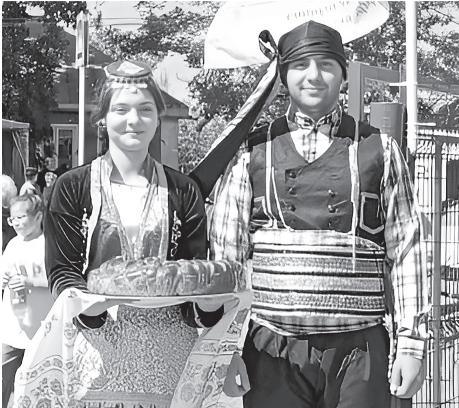
Почетных гостей на празднике встречали хлебом-солью

Село Спарта 14 сентября отметило свой вековой юбилей