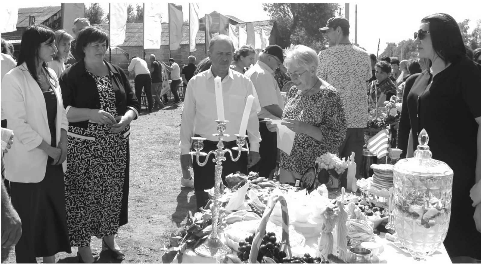
Представление греческой кухни на подворье «Тепло родного очага»

Для любознательных была организована экспозиция, рассказывающая об истории становления и